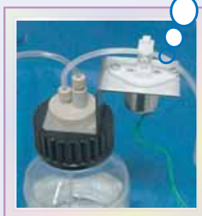
全オートクレープ対応 バルブボトルキャップセット