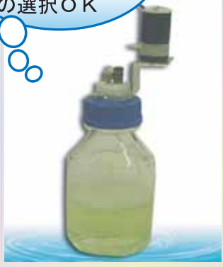
バルブボトルキャップセット